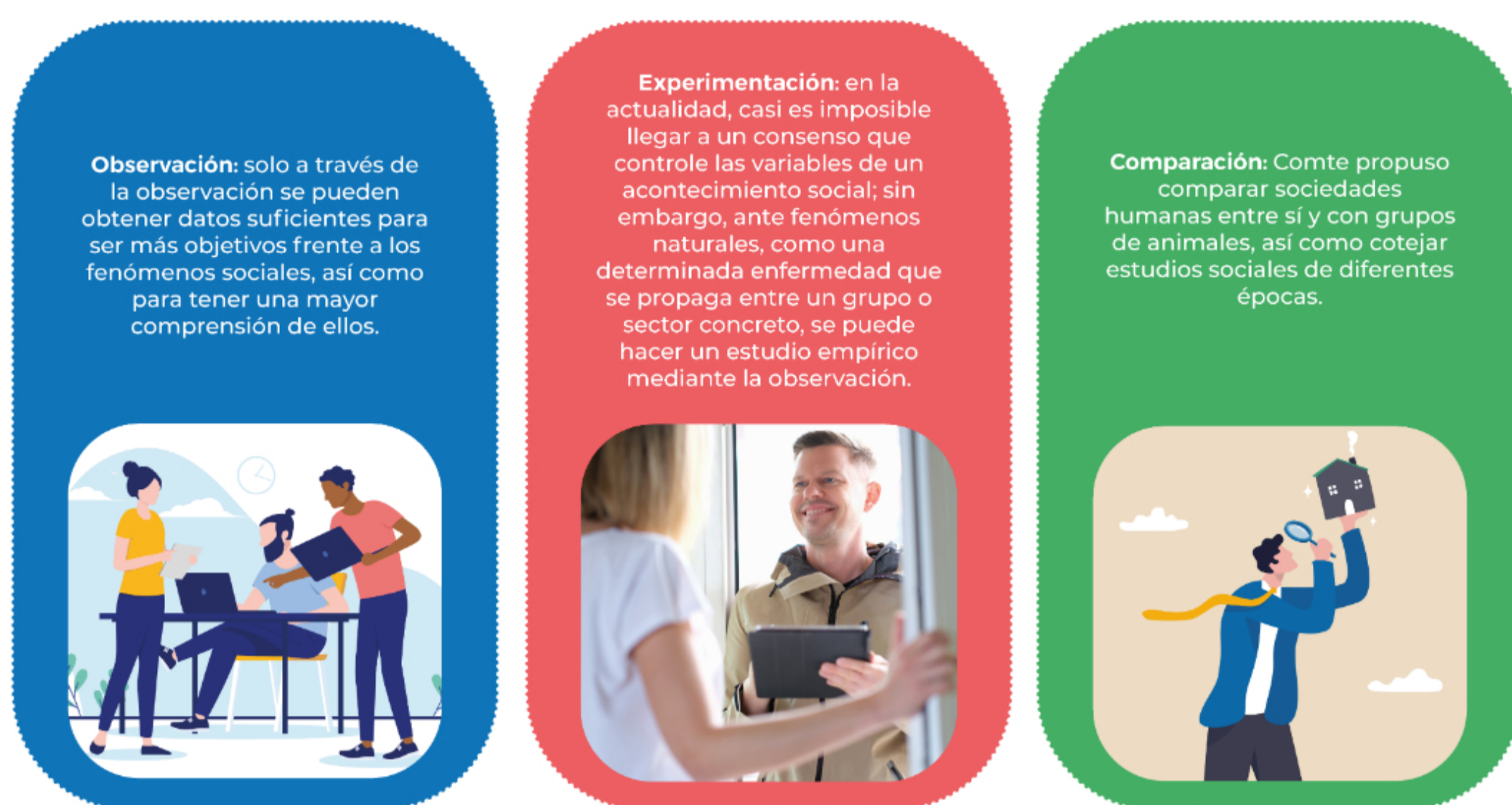
Figura 1. Métodos sociológicos.

Surgió en el siglo XIX, de la mano de Augusto Comte y sus seguidores, quienes afirmaban que el único conocimiento válido se obtiene gracias al método científico (Grudemi, 2022). A principios del siglo XIX, la sociología se estableció como ciencia, cuyo objeto de estudio se centró en la vida social del hombre, ya sea en grupos o sociedades; de esta manera, se buscaba un mejor funcionamiento de la sociedad y, a la vez, impulsar el positivismo. Para Comte, el sistema era corrupto y cruel, pues destinaba riquezas y bienes materiales solo a las clases privilegiadas; por tanto, con la intención de evitar otra revolución, planteó tres métodos sociológicos: